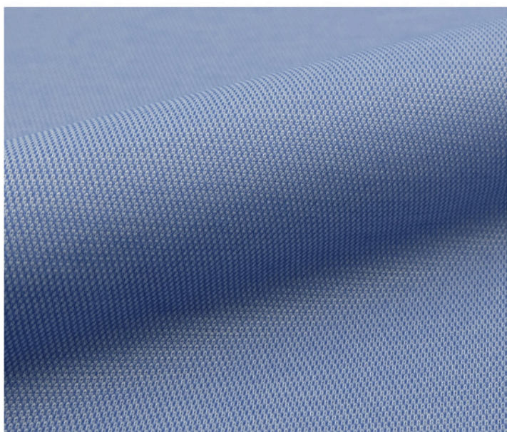
เพนซ์บลู BLE225 M

ผ้า Elitech 101 ลายอ็อกฟอร์ด (Oxford): 51% Pima Cotton, 49% Polyester, หน้าผ้า 70 นิ้ว, น้ำหนัก 140 GSM, 4.2 หลา/กิโลกรัม